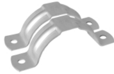
Rör Svep med Rilla / 171